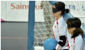
ゴールボールは、アイシェード（目隠し）を着用した1チーム3人のプレーヤーが、鈴入りのボールを転がすように投球し合いゴールに入れる競技で、選手たちはボールの音や選手同士の声、床の振動やラインの感触など視覚以外のさまざまな感覚を研ぎ澄ませてプレーを行います。

今の目標は、在籍している所沢のチームで、日本選手権を優勝することです。将来的な目標は、選手層がまだまだ薄いので、プレーしながら指導の勉強もして、後世の選手を育て、支えられる存在になりたいと思っています。