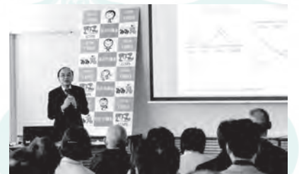
▲平成29年1月21日に、子どもの貧困対策をテーマに開催した政策討論会の様子