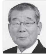
まつもとあきのぶ 松本明信② (自由民主党)