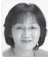
やさく いづみ 矢作いづみ④ (日本共産党)