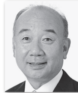
よしむらけんいち 吉村健一③ (公明党)