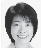
しろしたのりこ 城下師子⑤ (日本共産党)