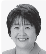
かめやまきょうこ 亀山恭子② (公明党)