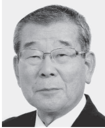
第 64 代副議長