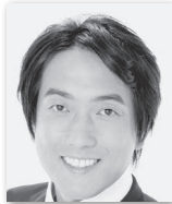
いりさわ ゆたか 入沢 豊② (自由民主党・ 無所属の会)