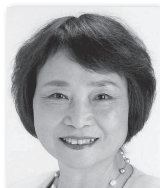
ひらいあけみ 平井明美⑧ (日本共産党)