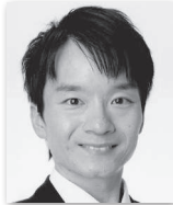
いしはら たかし 石原 昂① (自由民主党・ 無所属の会)