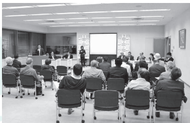
平成 29 年 5 月 17 日（水曜） 場所：所沢市役所3階全員協議会室

A ：この請願は3月定例会の中で請願者や保護者の方々のご意見を伺い、市に質疑を行い、問題が起きていることについては改善してほしいということで採択している。今は市にバトンを渡して委ねている状況であるため、議会では今どうなっているという答えは具体的には持っていない。今後しっかりと注視していきたい。