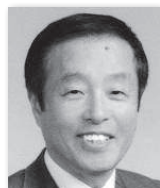
おおだちたかゆき 大館隆行③ (自由民主党)