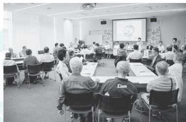
平成 29 年 5 月 27 日（土曜） 場所：所沢市子どもと福祉の未来館