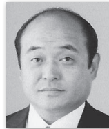
あおきとしゆき 青木利幸② (自由民主党)