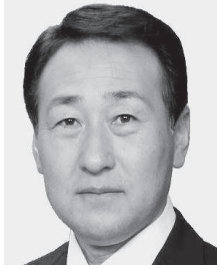
第 63 代議長