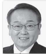
にしざわいちろう 西沢一郎③ (公明党)