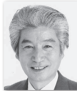
あらかわ ひろし 荒川 広⑨ (日本共産党)