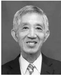
中井 真一郎氏 (中新井四丁目) (元所沢市長：昭和62年10月～平成3年10月・1期)