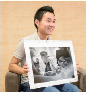
平成29年5月19日、日経ナショナルジオグラフィック写真賞2015グランプリ受賞作品「88歳の現役医師」(4枚組写真)の1枚とともに。

今後の目標は、自分の写真を海外のギャラリーで展示すること、さらに美術館で展示することが夢です。人々の脳裏に焼きつく写真を展示したいと思っています。