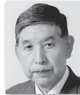
おさかべせいいち 越阪部征衛⑤ (自由民主党)