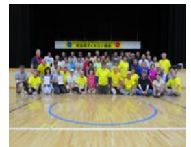
↑所沢ディスコン大会