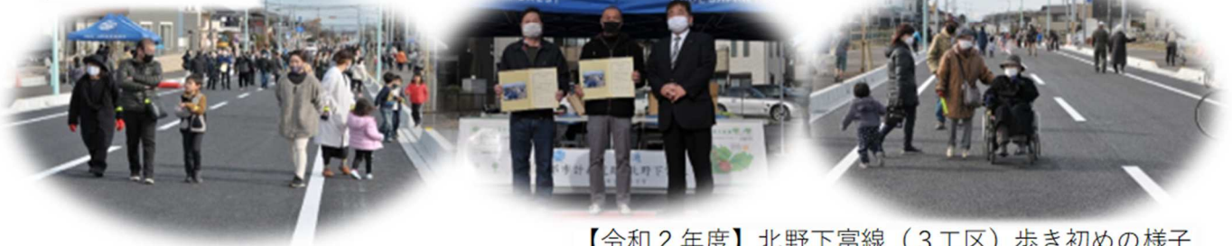
【令和2年度】北野下富線（3工区）歩き初めの様子