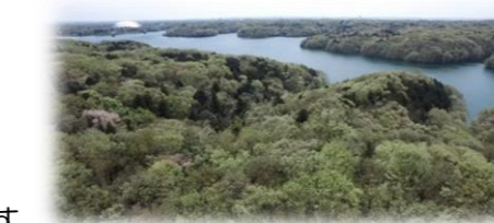
空からみた狭山丘陵