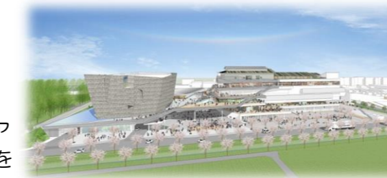
「ところざわサクラタウン」完成予定図

映画やテレビ番組等の撮影場所誘致や、撮影支援を行うロケーション・サービスを推進するとともに、SNSを活用した効果的な情報発信を図ります。