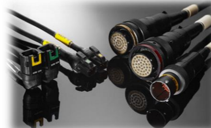
市内事業者の高付加価値製品の一部(世界のモータースポーツで使用されているファイヤーハーネス)

認定農業者は地域の農業を担う中心的な存在であり、また本市の農業を牽引する存在であるため、認定農業者が行う設備投資や新たな農業の展開に向けた取組を支援することにより、農業の近代化を図り、自立経営農家を育成し、都市近郊農業の底上げと活性化を図ります。