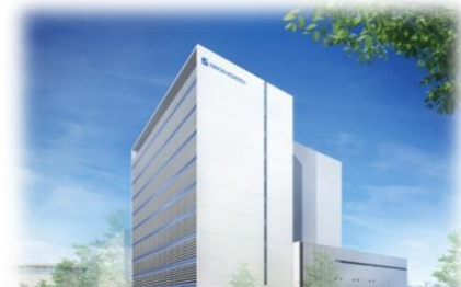
所沢駅東口駅前建設された日本光電工業株式会社総合技術開発センター