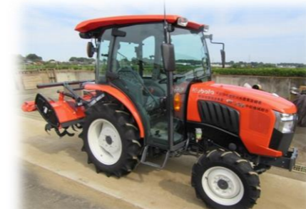
認定農業者に対する設備投資の支援