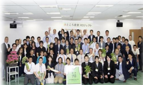
「農商工連携のためのきっかけづくり交流会」を契機に結成された「ところ産食プロジェクト」