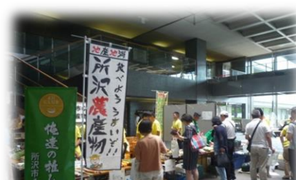
所沢市4Hクラブ(若手農業者団体)の農産物発表会