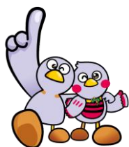
埼玉県のマスコット 「コバトン」「さいたまっち」

※ 2 さいたま市、川越市、越谷市、熊谷市、川口市、所沢市、春日部市、草加市及び久喜市は各市役所へお問い合わせください。