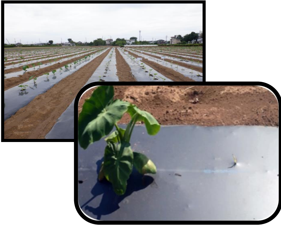
生分解性 マルチフィルム