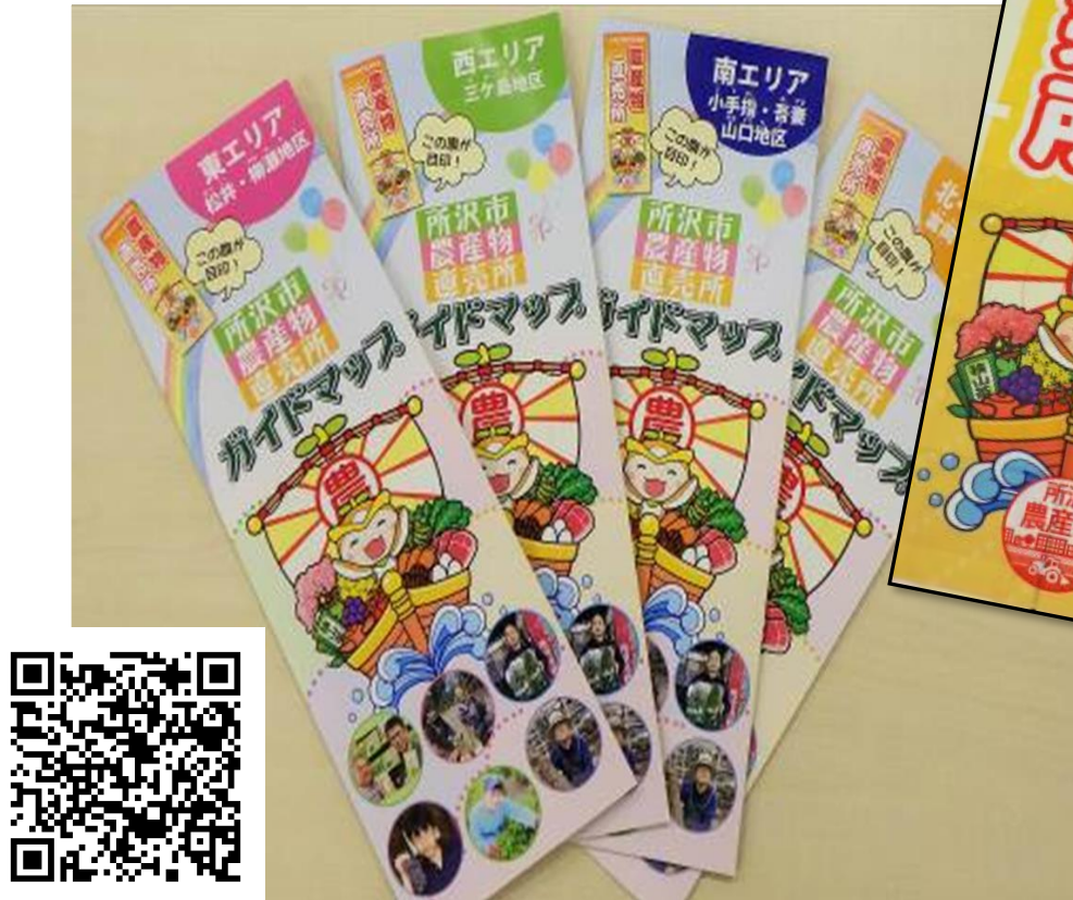
直売所 ガイドマップ