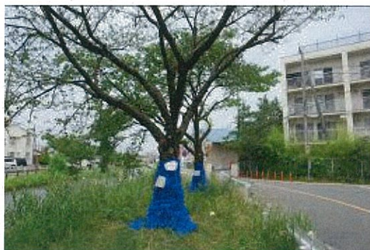
ネットを樹幹に巻き付けている様子

また、当該種による加害が進むと、落枝、倒木等による人的被害が発生するおそれがあるとともに、枯死した樹木を安易に移動させることは、当該種が拡散し、被害の拡大につながるので注意が必要。