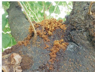
枝にたまったフラス(植物防疫所原図)