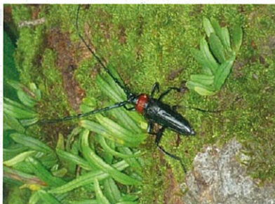
成虫(植物防疫所原図)