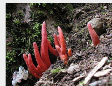
カエンタケ ブナ、ナラに地上から指が出ているように発生します。