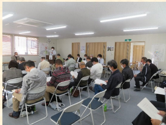
事業計画変更の説明をしている様子