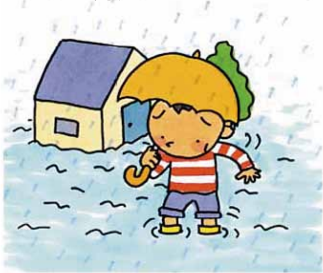
下水道がなかったら…