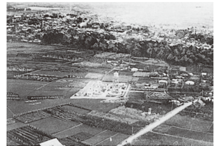
建設当時の第一浄水場

所沢市では、昭和12年に、県内で6番目に水道事業が始まりました。また、昭和43年に所沢下水処理場が完成し、県内で6番目に下水処理場の運転が始まりました。