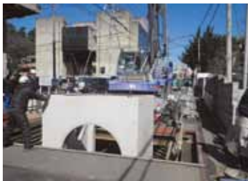
マンホール耐震工事の様子

地震で下水道管が壊れると、トイレの水などが流せなくなったり、道路が陥没して車が通れなくなり、救助活動に支障をきたすこともあります。そのため、地震に強い下水道管やマンホールに取り替えたり、補強する工事を行っています。