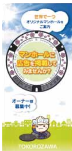
マンホールリーフレット