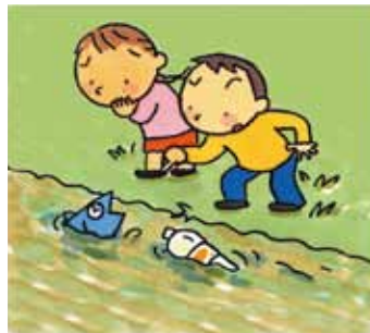
下水道がなかったら…

汚れた水は、下水道管で下水処理場に集められ、きれいにしてから川や海に戻っています。きれいな水の循環を保つことで、魚や他の生物がすむことのできる清流がよみがえります。