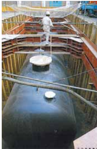
耐震性貯水槽の工事の様子