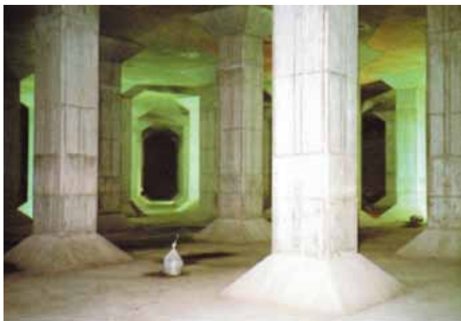
雨水調整池の中の様子

※上砂公園調整池、中央公園調整池、中砂公園調整池、桃の木公園調整池、泉町調整池、中道公園調整池