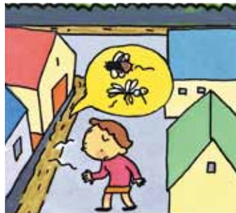
下水道がなかったら…

汚いドブや溝がなくなることで、蚊やハエがいなくなり、きれいなまちで、快適で安心した生活ができます。まちに汚水が直接流れないので、伝染病を防ぐ役割もあります。