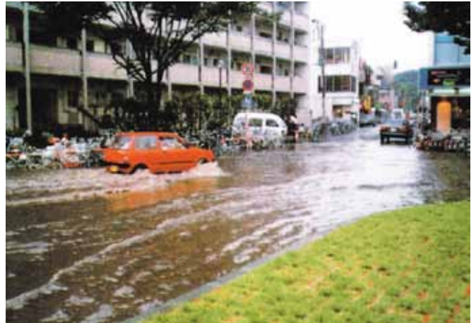
新所沢駅西口の浸水被害

それまでは、昭和30年代に整備した合流管（雨水と汚水を一緒に流す下水道管）だけであふれた雨水を処理していましたが、あまりにも量が多くなり、それだけでは対応しきれなくなっていました。