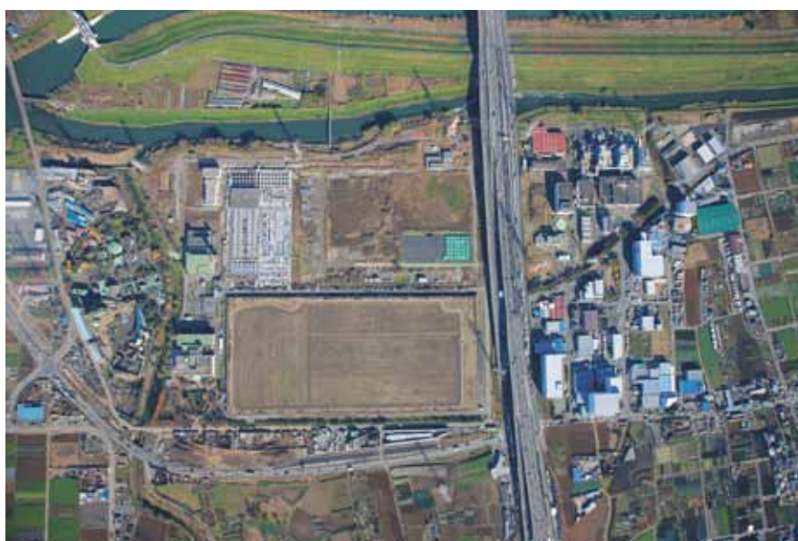
新河岸川水循環センター（和光市）