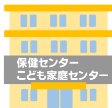
保健センター こども家庭センター