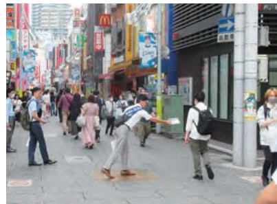
配布時の様子 (プロペ通り)

7月8日(土)、所沢市と共催で「青少年の非行・被害防止強調月間街頭啓発キャンペーン」を開催しました。当日は、所沢市長、議長、教育長、警察署長をはじめ、総勢115名の参加者の協力を得て、啓発リーフレットなどを約1600人の市民の方へ配