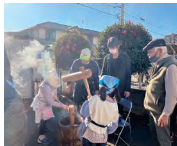
餅つきの様子 (子ども食堂)

配布物は、社会福祉協議会からの支援や企業からの提供、農家さんや施設からも提供されています。活動している方はボランティアで、皆さん笑顔で接していて、相談に乗ったり、登録している人が来ないと連絡を取ったりと、物品の受け渡しだけではない心配りと関係性を感じました。