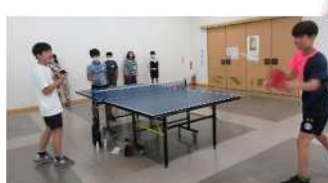
卓球教室 (8/4) 協力・所沢北高校卓球部