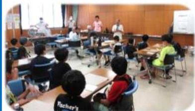
将棋教室 (7/25 ~ 毎火曜全5回) 協力・新所沢東将棋同好会