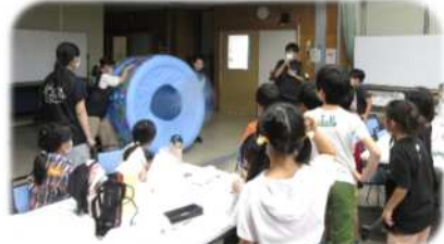
科学教室 (8/18) 空気砲の様子 協力・東大 CAST