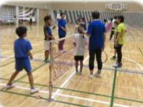
ミニテニス (8/22、23) 協力: ミニテニス優飛