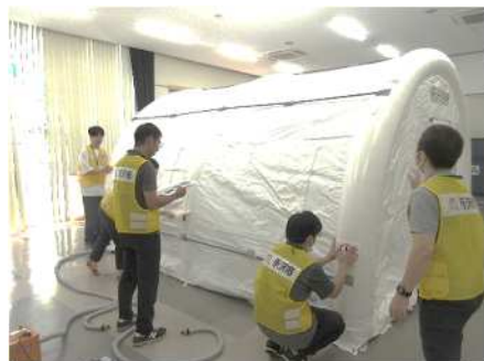
▲支部訓練はテント設営や発電機の稼働などを行いました

災害は季節や時間を問わずいつやってくるかわかりません。油断せず防災グッズの点検や備蓄食料の消費期限等のチェックも忘れずに実施しましょう!