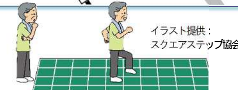
イラスト提供: スクエアステップ協会