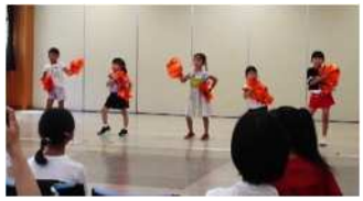
チアダンス教室 (8/3) 協力・所沢北高校チアダンス部