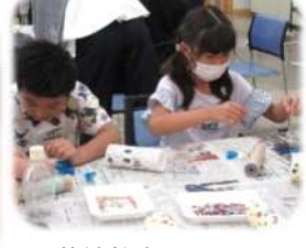
万華鏡教室 (8/19) 協力・所沢北高校美術部