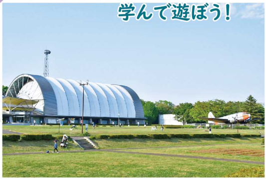
No.04 東川さくら おさんぼコース