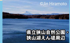
県立狭山自然公園・狭山湖えん堤周辺