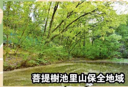
菩提樹池里山保全地域

「(公財)トトロのふるさと基金」がナショナル・トラスト活動で取得した「トトロの森」の第1号地です。ボランティアの方の管理活動により美しい樹林地になっています。