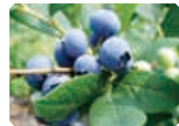
ブルーベリー狩り

4月上旬～5月上旬。掘りたてのたけのこは、煮ても焼いてもおいしい!自分で掘ったたけのこで、旬のたけのこごはんはいかが。